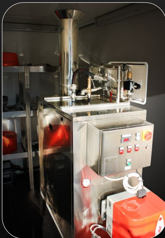
Steam Unit 150

Einfassprofile an Türöffnung und Regenleiste über der Tür